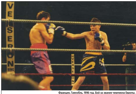
Франция, Гренобль, 1996 год, бой за звание чемпиона Европы.