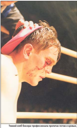
Тяжелый хлеб боксера-профессионала пропитан потом и кровью.