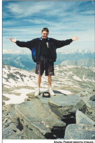
Альпы. Редкие минуты отдыха.

таки попал, и не один раз, только уже в составе «Колумбуса». Причем, во время своей второй поездки, пребывая в Нью-Йорке, он тренировался не где-нибудь, а в родном зале Тайсона, из которого, кроме Железного Майка вы-