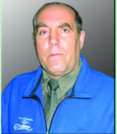
С 1993 года — директор СДЮШОР бокса г. Кременчуга.

В 1994-1995 годах — тренер молодежной сборной Украины.