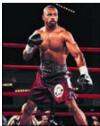
1. РОЙ ДЖОНС 49-1 (38 КО)

Вашему вниманию мы предлагаем десятку лучших round-for-round боксеров-профессионалов уходящего 2003 года. Да, ну и годик! Особенно в полусреднем дивизионе! Если вдруг среди вас окажется чемпион мира в полусреднем весе, не думайте, что вас ждет безоблачная жизнь, возможно, ваш номер в этом списке уже занят.