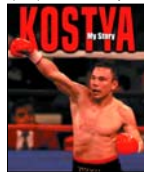
3. КОСТЯ ЦЮЗО 30-1-1 (24 КО)

Какется, что Бернард Хопкинс, как хорошее вино, становится все лучше и лучше с возрастом. Это плохие новости для звезд младшего среднего веса — Оскара де ла Хойя и Шейна Мосли, а также для юных дарований — Жермана Тейлора и Джеффа Лейси. Старый боксерский волк никогда не собирается уходить и уступать дорогу. Его послужный список против впечатляет: 17 раз он защитил свои титулы,