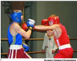
На ринге турнира в Кузнецовске.

И вот этот оптимист собирает вокруг себя любителей бокса и